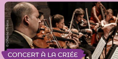
CONCERT À LA CRIÉE