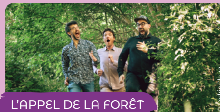
L'APPEL DE LA FORÊT