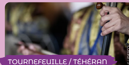
TOURNEFEUILLE / TÉHÉRAN