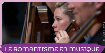
LE ROMANTISME EN MUSIQUE