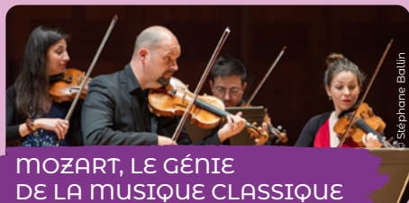
MOZART, LE GÉNIE DE LA MUSIQUE CLASSIQUE

Au programme : des genres musicaux variés, des groupes de tous horizons, pour toutes les oreilles !