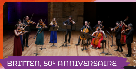
BRITTEN, 50 e ANNIVERSAIRE