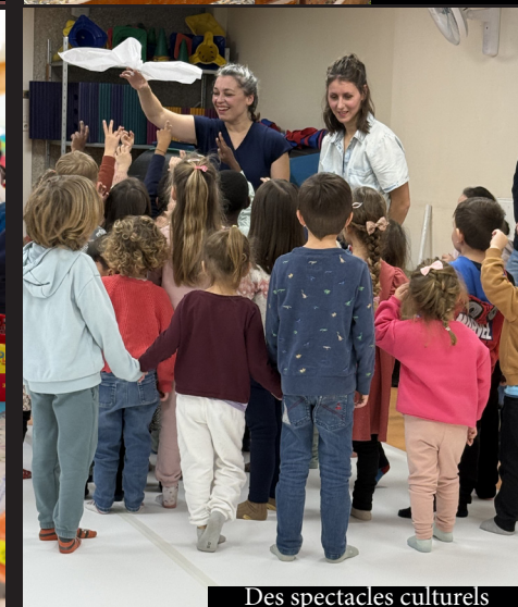
Des spectacles culturels