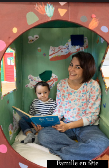
Famille en fête