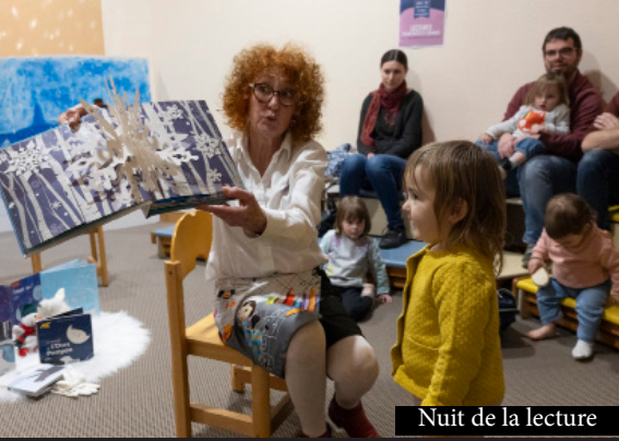
Nuit de la lecture