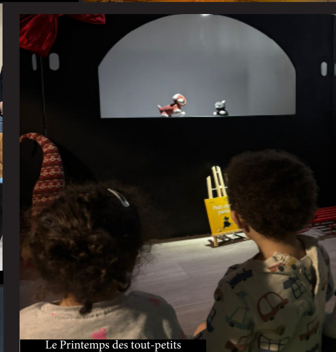
Le Printemps des tout-petits