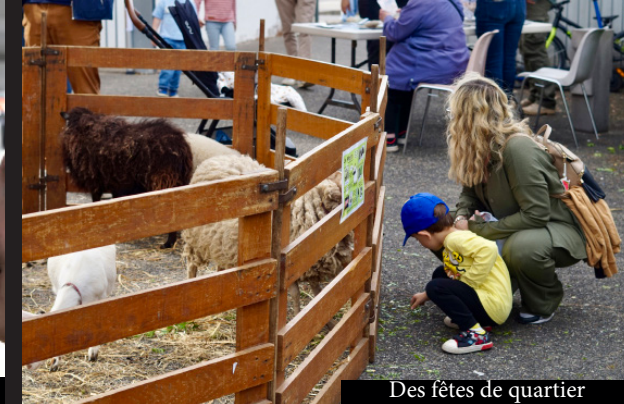
Des fêtes de quartier