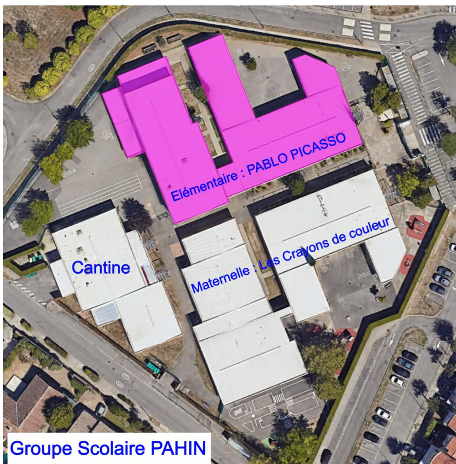
Bâtiment sujet du présent rapport