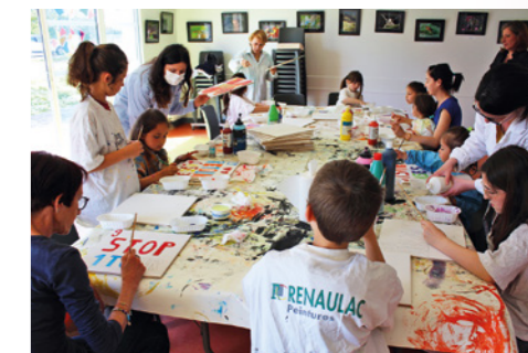
Atelier “Petites mains”